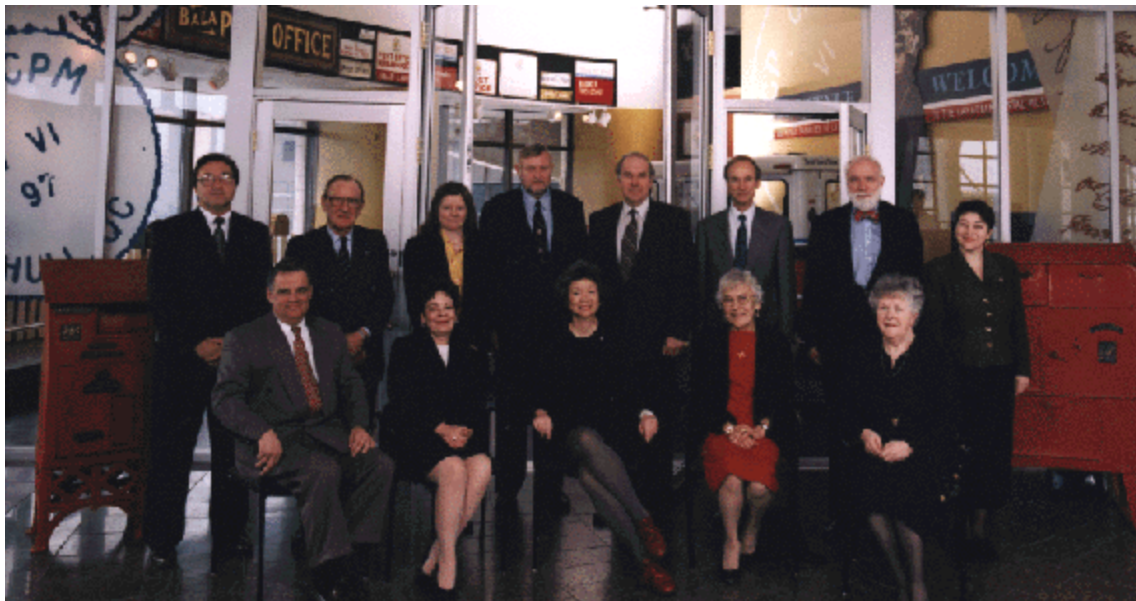
Le Conseil d'administration et les dirigeants de la Société devant le Musée canadien de la poste.

La Société du Musée canadien des civilisations est une société d'État constituée en vertu de la Loi sur les musées (Lois du Canada 1990, chapitre 3) , entrée en vigueur le 1 er juillet 1990. La Loi énonce que la Société a pour mission « d'accroître, dans l'ensemble du Canada et à l'étranger, l'intérêt, le respect et la compréhension critique de même que la connaissance et le degré d'appréciation par tous à l'égard des réalisations culturelles et des comportements de l'humanité, par la constitution, l'entretien et le développement aux fins de la recherche et pour la postérité, d'une collection d'objets à valeur historique ou culturelle principalement axée sur le Canada ainsi que par la présentation de ces réalisations et comportements, et des enseignements et de la compréhension qu'ils génèrent. »