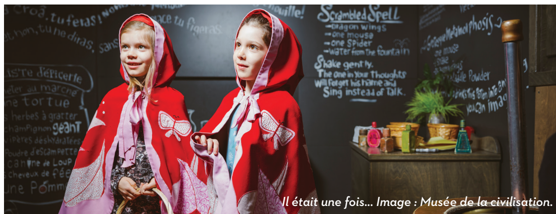
Il était une fois...