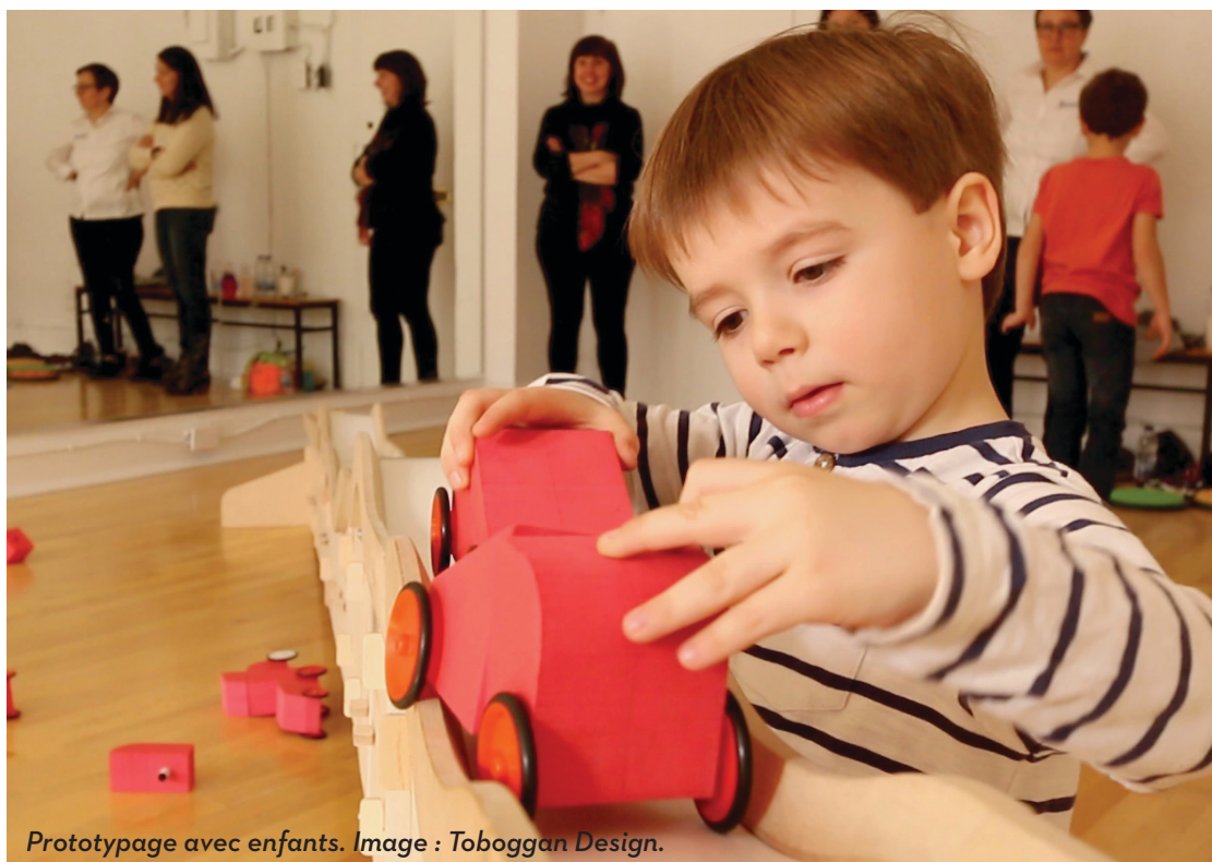
Prototypage avec enfants.